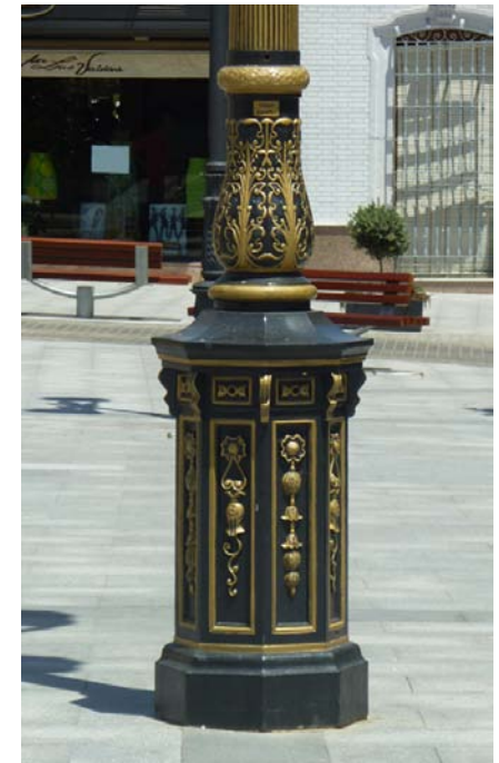
Ref. MONU-5P Foto: Palacio real - Madrid