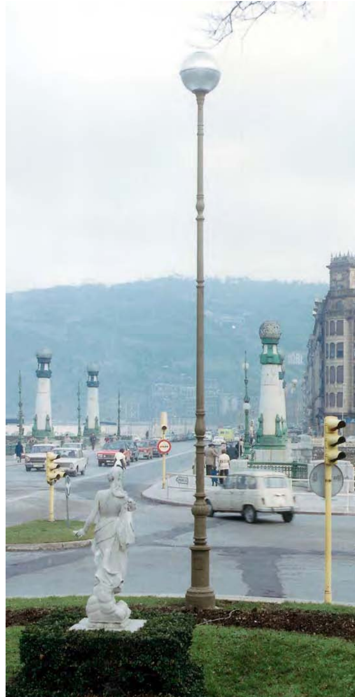
Ref. TXIS Foto: Puente del Kursaal - San Sebastián