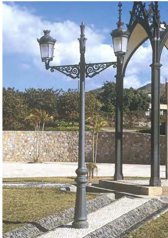
Ref. VC-2P Foto: Almuñecar - Granada