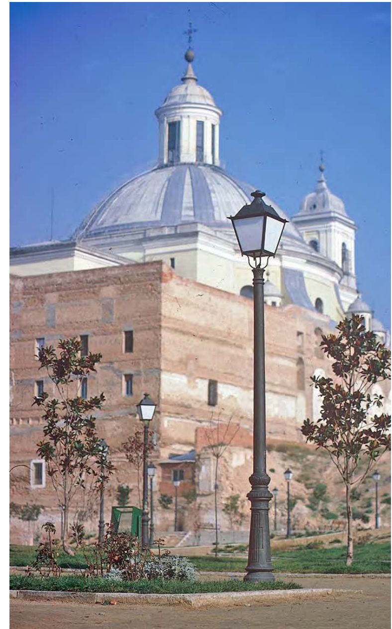
Ref. VC Foto: Madrid