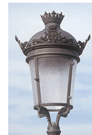
Farol tipo II