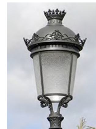
Farol tipo I