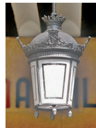
Farol tipo II suspendido