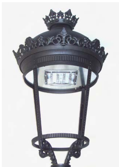
Farol equipado con LEDs